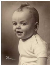
Portrait of a Young Child, Studio Saint-Mars, ca. 1950. Sammlung Michel Campeau

Pressekonferenz: Freitag, 12. Juli 2019, 11 Uhr