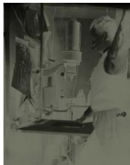
Photographer Makin Girlie. Pin-Up Print with Photo Enlarger, c. 1940, 2014 (Simulation des Negativs). Aus der Serie »Gestures and Rituals of the Darkroom« Collection Michel Campeau

Pressekonferenz: Freitag, 12. Juli 2019, 11 Uhr