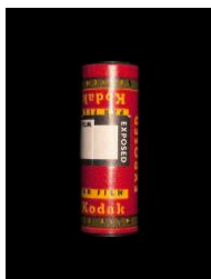
Exposed Kodak 120 Verichrome Pan Film, made in Rochester, NY, 1956. Aus der Serie »Industrial Splendour and Fetishism: The Bruce Anderson Collection« (2012–2014) © Michel Campeau