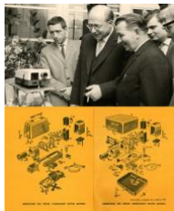
Slide projector and technical manual, c. 1960.