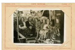
Donkey Cart, Tijuana, Mexico, ca. 1955. Aus der Serie »The Donkey that Became a Zebra«