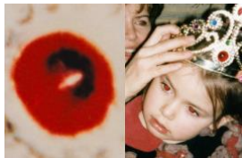
Ohne Titel. Aus der Serie »Red-Eye Trompe l'oeil« (1998–2005)