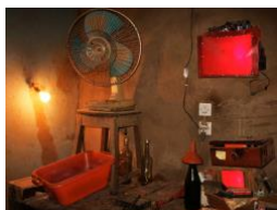
Ohne Titel 7953, Niamey, Niger, 2005–2009. Aus der Serie »Darkroom« (2005–2010)