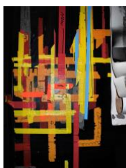
Ohne Titel 0310, Montreal, Quebec, 2005–2009. Aus der Serie »Darkroom« (2005–2010)