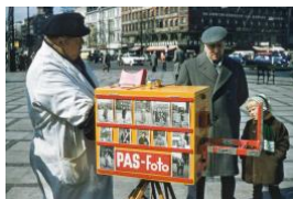
Street Photographer, Copenhagen, Denmark, ca. 1956. Aus der Serie »Capital Camera Exchange Inc. – Anonymous Amateurs and Professional« (2015–2018)